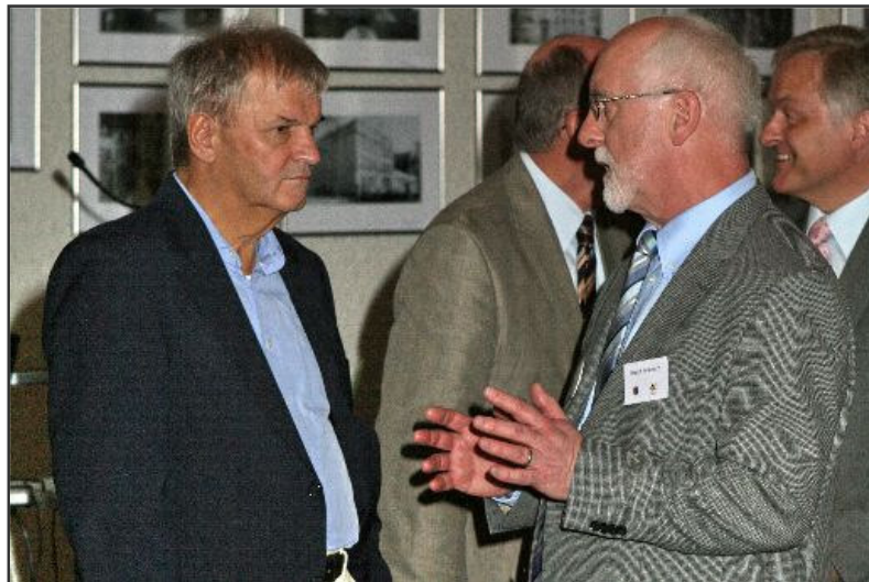
Karl Diller, MdB, Parlamentarischer Staatssekretär im Bundesfinanzministerium

Prominente Gäste am Tag der offenen Tür aus Anlass der Feiern zum 60jährigen Bestehen des Landes Rheinland-Pfalz